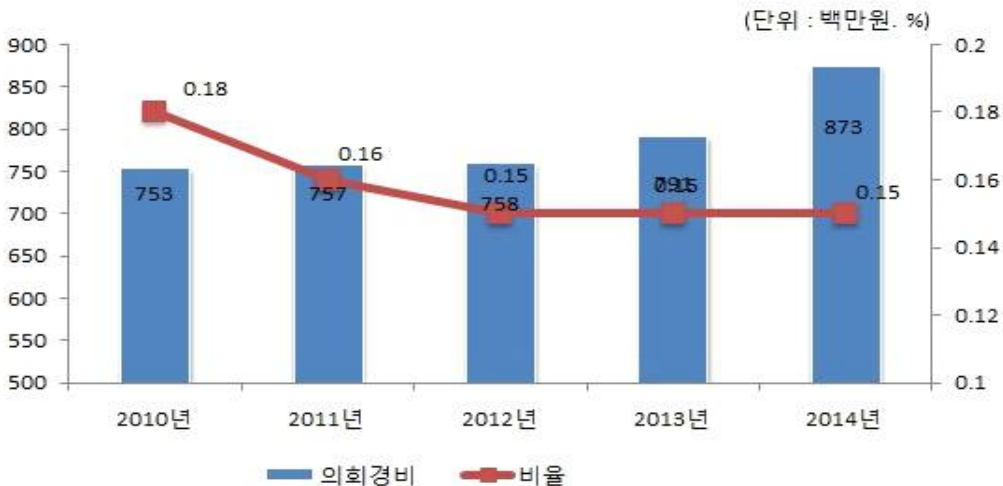
의회경비 연도별 집행액 및 비율 변화