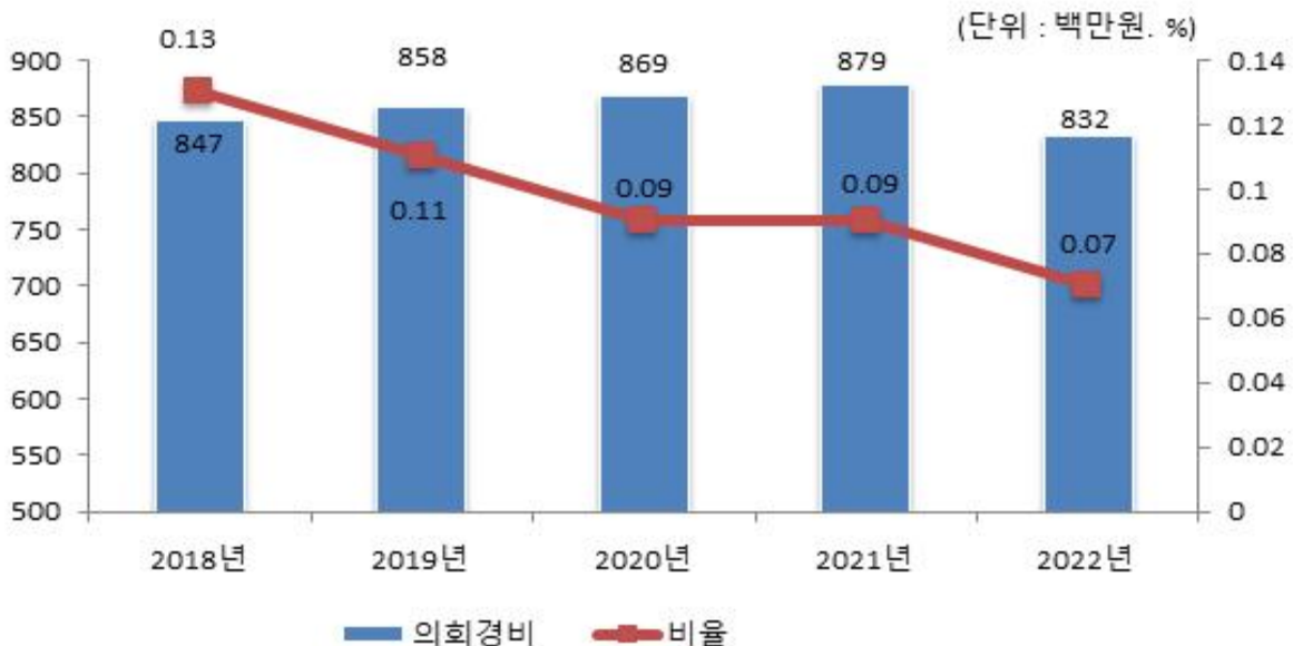
의회경비 연도별 집행액 및 비율 변화